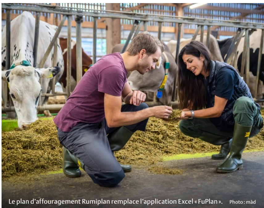
Le plan d'affouragement Rumiplan remplace l'application Excel « FuPlan ».

Le gestionnaire d'exploitation numérique barto vise à couvrir l'ensemble du cycle agricole en production végétale et en production animale. Avec Rumiplan, fenaco pose des jalons importants dans ce dernier domaine.