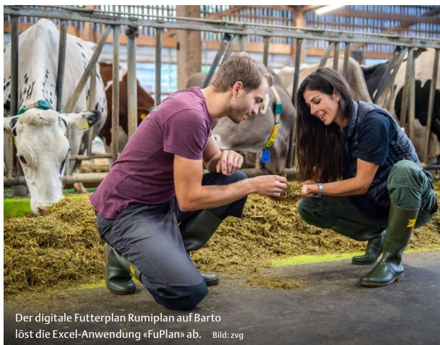
Der digitale Futterplan Rumiplan auf Barto löst die Excel-Anwendung «FuPlan» ab.

Der digitale Hofmanager Barto hat das Ziel, den gesamten landwirtschaftlichen Kreislauf in der Tierhaltung und im Pflanzenbau abzudecken. Mit dem Rumiplan-Baustein geht es in der Tierhaltung einen grossen Schritt weiter. ■